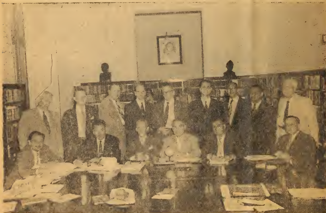
LA COMISION DE COOPERACION PRESBITERIANA DE LA AMERICA LATINA